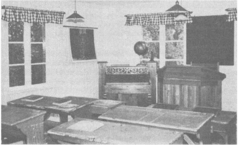
1 den gamla skolsalen från 1808 har samlats gamla skolinventarier från hela kommunen. De allra flesta av dessa är av betydligt yngre datum än skolhuset, vars ursprungliga inventarier sannolikt gått förlorade under årens lopp. Endast den bibel som skolan fick 1824 av Nerikes bibelsällskap i Askersund, finns ännu i behåll.

cember 1797 där han "til Hardemo, eller Halme Kyrkas fattiga" skänker en summa av 1 000 riksdaler riksgälds. Räntan skall utdelas varje år på Andersmässodagen till de mest nödlidande. Följer inte socknen den bestämmelsen, skall pengarna i stället tillfalla Örebro hospital. I samma testamente skänker han 500 riksdaler till "Öija och Måsby soldat, jag menar den Soldat som bor på torpet Grisbrun". Räntan skall delas ut varje år antingen soldaten är i tjänst eller gammal och sjuklig. Men det var ett viktigt förbehåll, likadant som det i testamentet till skolan. Han skriver "med det uttryckeliga förbehåll at ingen Adelsman får åtnjuta desse interesse penningar och at intet Öfwersten eller eho han wara må wid Regementet få befatta sig med detta utan Halme Sochen Män skall besörja om detta såsom för Sochnens fattiga at alt ärliga tilgåår, och Gud gifwe, det så rättwist utdelas som jag det af godt hjerta gifwer".